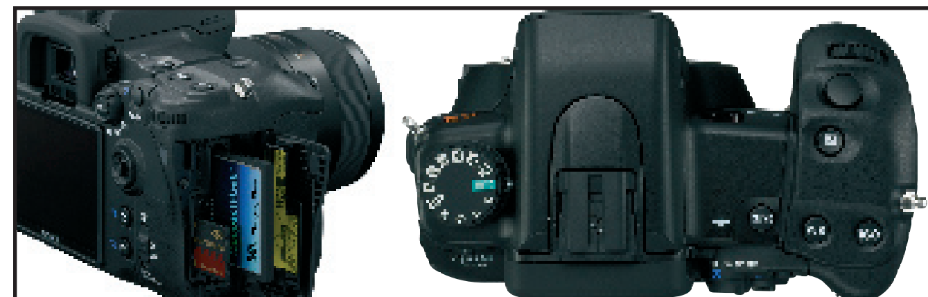
L'Alpha 700 dispose d'une double compatibilité MS Duo/CF I/II. La vue plongeante révèle les touches d'accès direct et les pictogrammes du barillet de modes. Sony y a installé quelques programmes résultat et, plus intéressant, une position "MR" appelant une des 3 configurations mémorisées.

Le modèle de présérie que nous avons manipulé possédait une zone sensible sur sa poignée (autre héritage du Dynax 7D), destinée à réveiller le boîtier dès sa saisie : elle ne sera pas installée sur la version définitive destinée à la zone Europe pour cause de présence de nickel, incompatible avec la directive RoHS (réduction des substances nocives). En revanche, l'Eye-start – qui fait zonzonner l'AF lorsqu'on porte l'appareil en bandoulière – est toujours présent sous l'oculaire. Son principal avantage est d'éteindre automatiquement l'écran arrière lorsqu'on porte l'œil au viseur et il est désactivable.