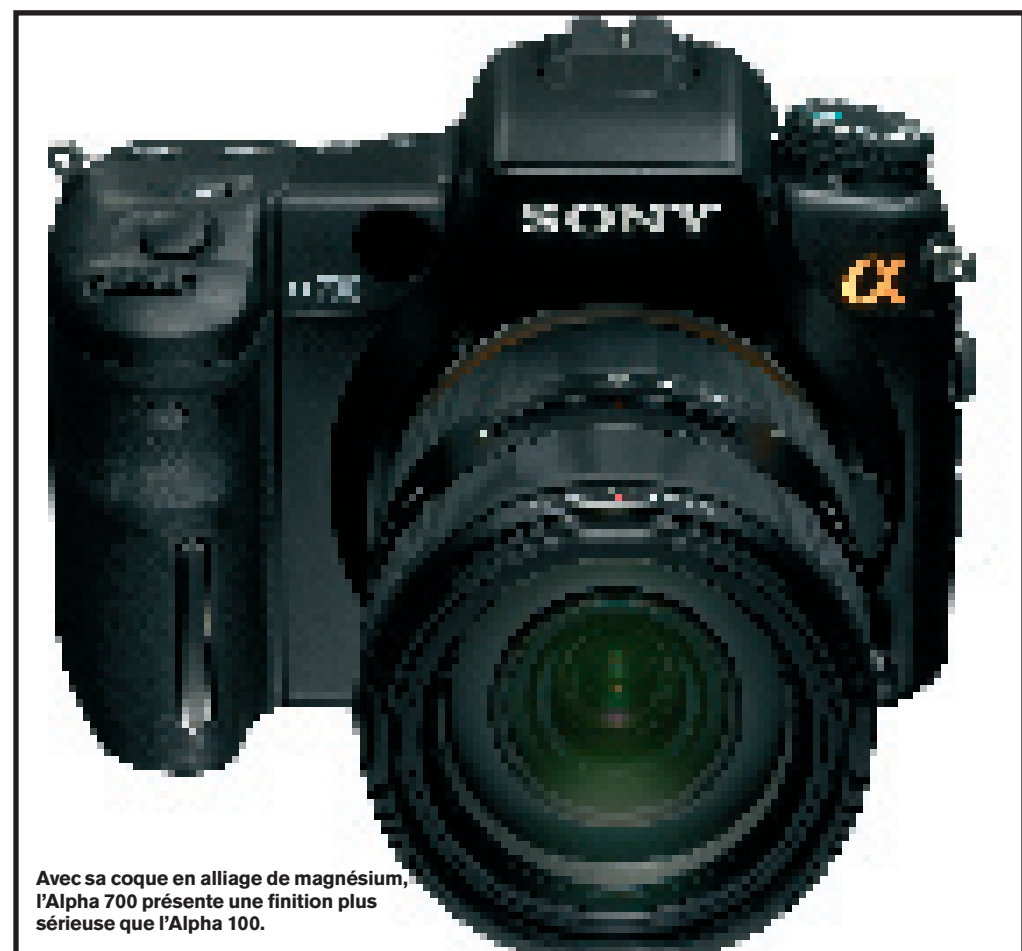
Avec sa coque en alliage de magnésium, l'Alpha 700 présente une finition plus sérieuse que l'Alpha 100.