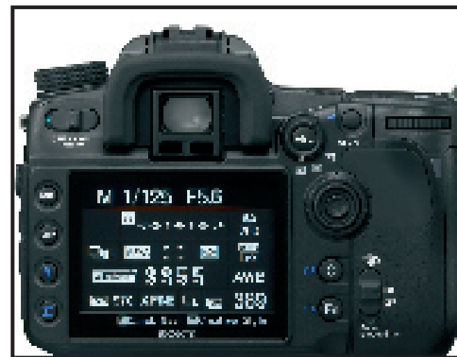
Les doigts ont de quoi s'occuper! A des boutons à la finalité facilement identifiable s'ajoutent une touche "Fn" appelant un tableau de pilotage très complet et une touche "C" (comme custom), à affecter au paramètre de son choix.

Sony a particulièrement soigné la synergie capteur/DSP (noms de code "Exmor" et "Bionz") pour la gestion des hautes sensibilités. La réduction du bruit s'effectue